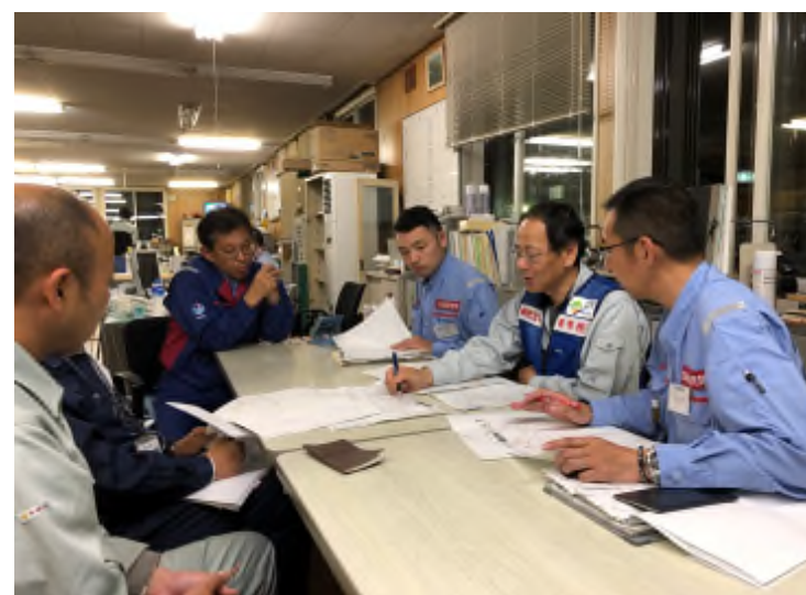
関係機関調整(厚真町、寒地土研)