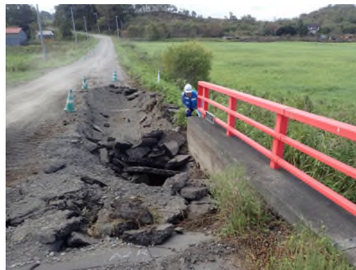
道路班新生橋調査の様子