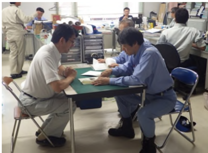
安平町へ調査結果説明