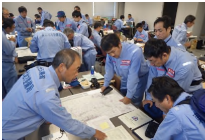
道路班事務引き継ぎ