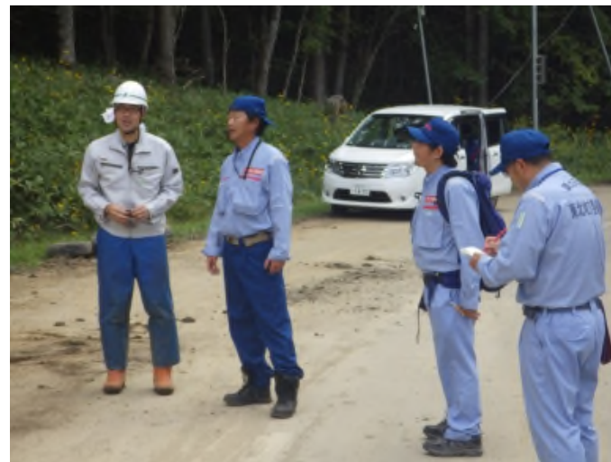
地元への聞き取り調査