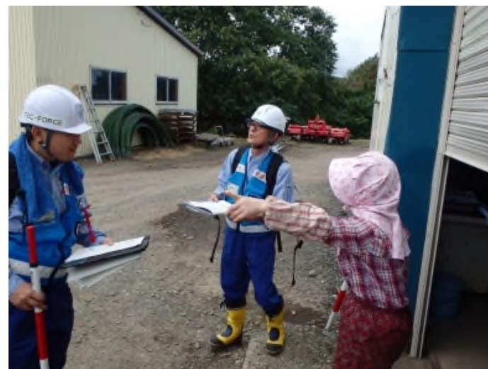
安平町追分地区砂防班崩落箇所聞き取り