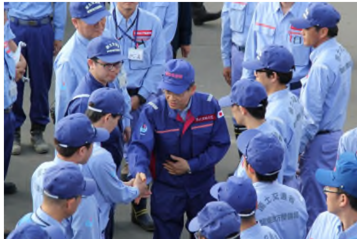
大臣が隊員一人一人と握手する様子