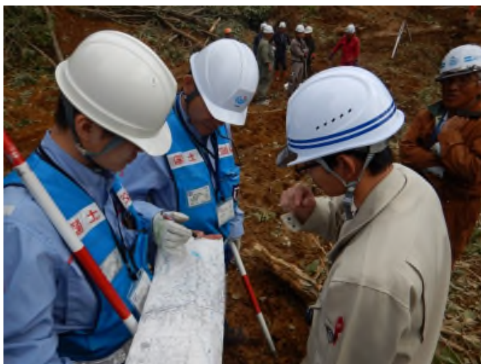
安平町湯沢地区砂防班調査説明