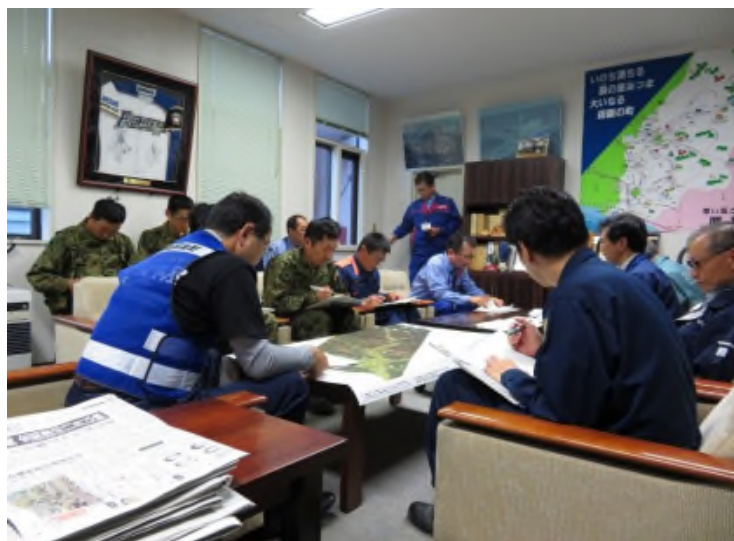
関係機関代表者会議（厚真町長室）