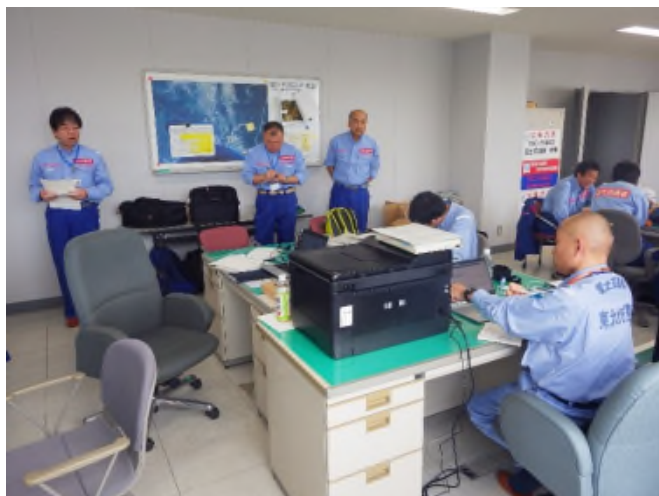
全体ミーティング状況(苫東中央管理ST)