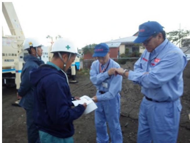
照明車作業前打合せ(日高町富川学校)