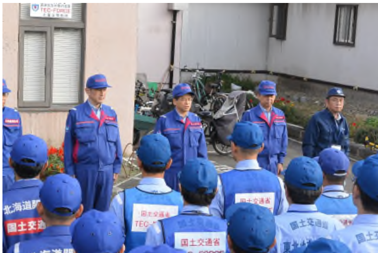
石井国土交通大臣からの激励

9月13日(木)、厚真町を視察した石井国土交通大臣から、TEC-FORCE 隊員（北海道開発局、地方整備局(東北・関東・北陸・中部・中国・四国・九州)） 及びJETT隊員(気象庁)約60名が激励を受けました。