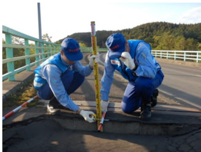
道路班常盤橋調査の様子