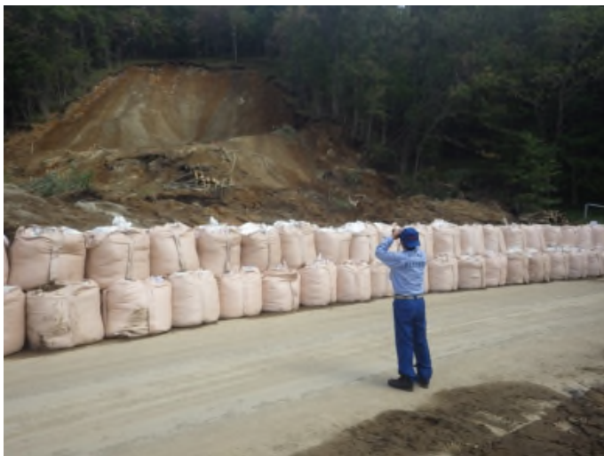
土砂崩落概況調査