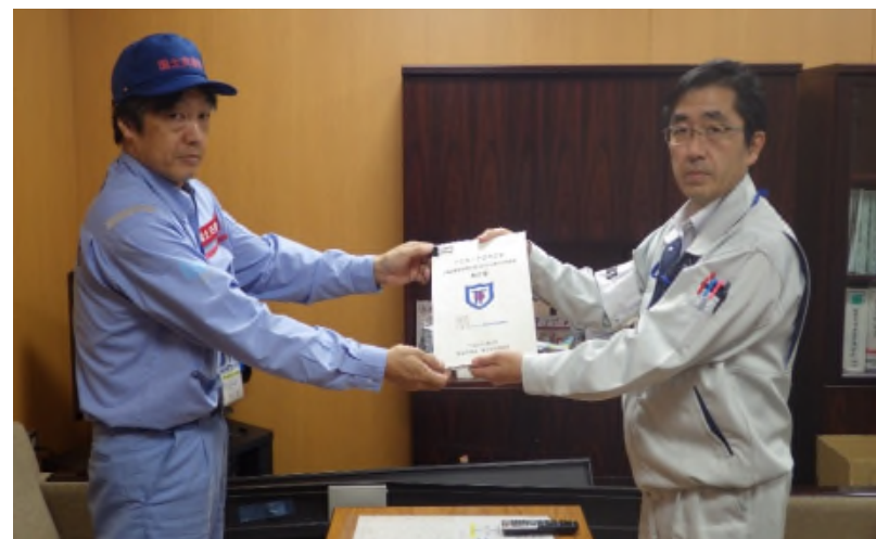
安平町長へ調査結果報告