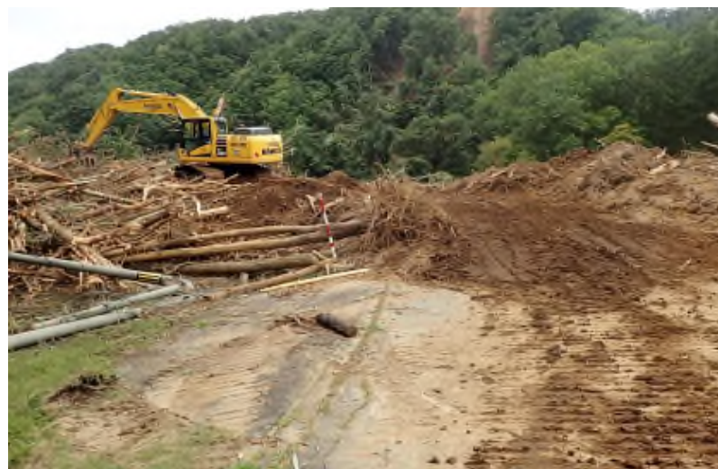
町道幌内線 道路啓開作業の様子