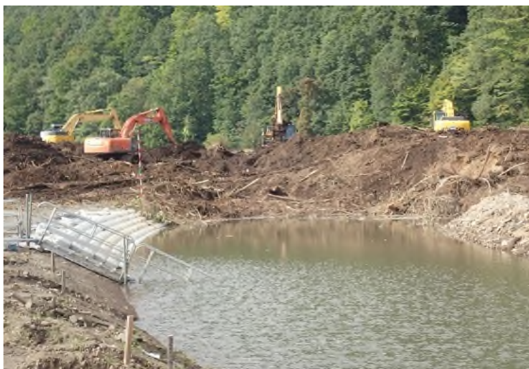
厚真川 河道掘削作業の様子