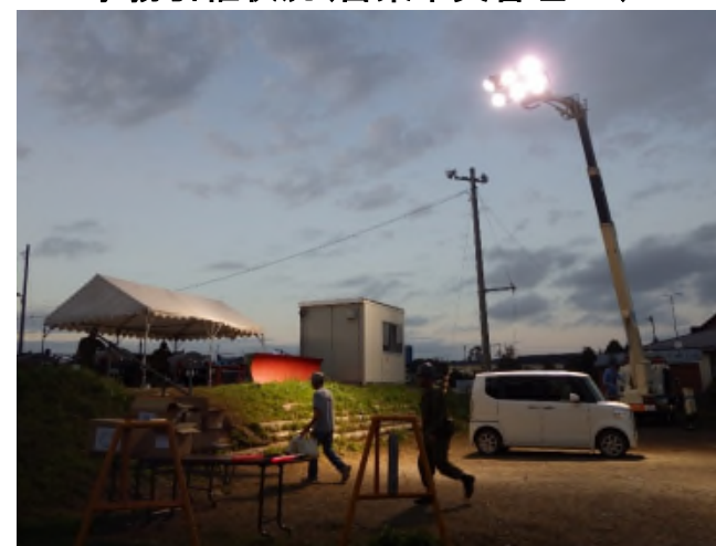
照明車の稼働状況(日高町富川学校)