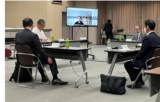
第1回丘珠空港PI推進協議会(10月14日) 第1回丘珠空港PI評価委員会(10月15日)