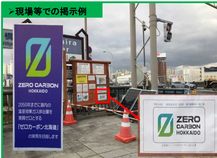
➤現場等での掲示例