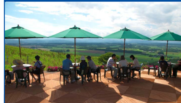
シーニックカフェ