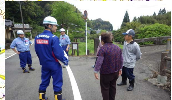
豊野地区 東経塚・部田線の被害状況を調査する道路班