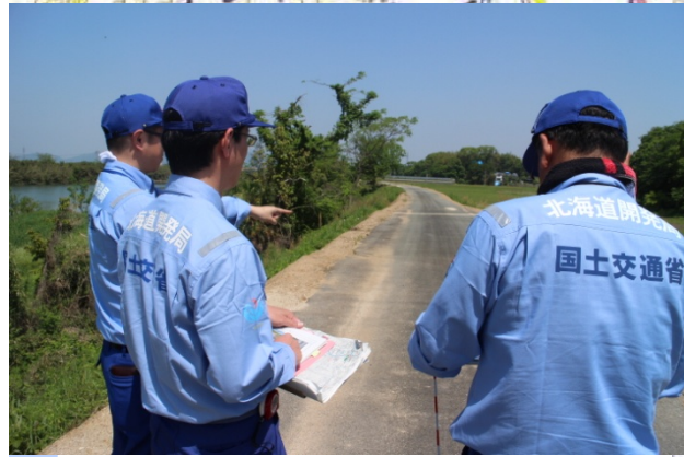
緑川の現地被災調査を行う砂防班