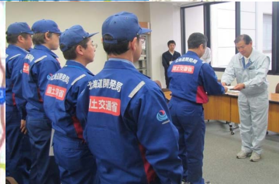
甲佐町町長へ調査結果報告書を提出する河川班