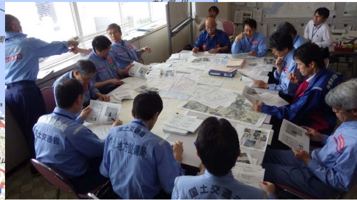
各地方整備局による隊長会議の状況(総括班)

被災状況調査班(河川) 4/22～4/28 阿蘇市 黒川(県管理河川)の被災状況調査