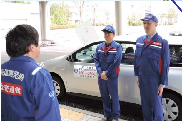
5月4日 総括班 出発式