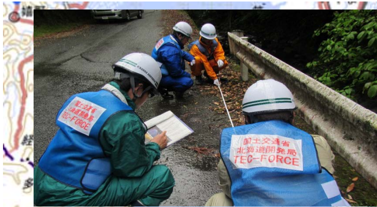
菊池市内の橋梁調査状況