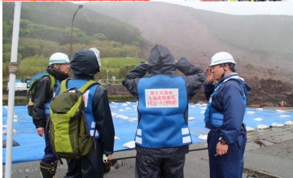
5月4日からの調査箇所の確認を行う砂防班