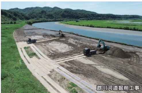
鶴川河道掘削工事