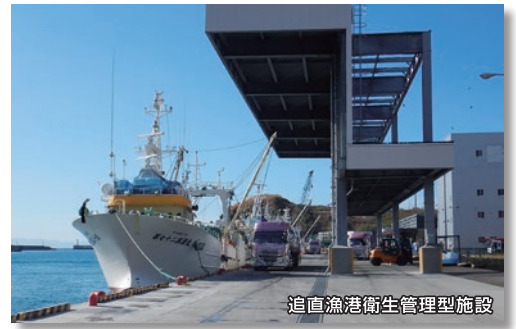
追直漁港衛生管理型施設