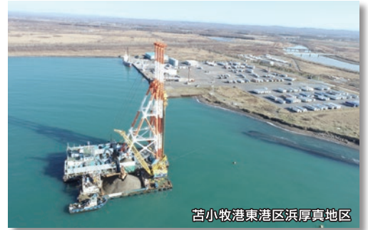
苫小牧港東港区浜厚真地区