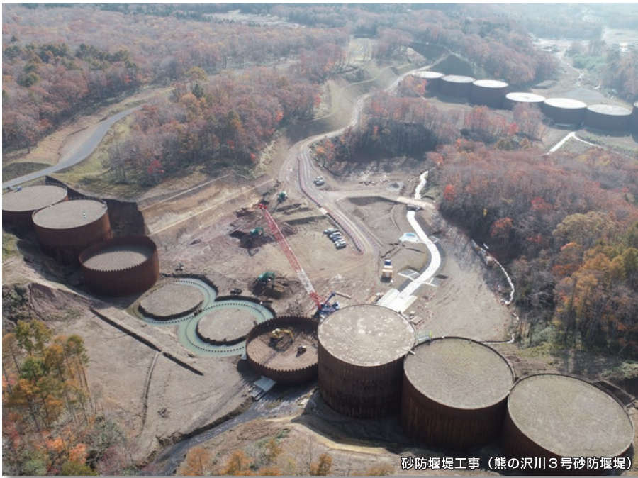
砂防堰堤工事（熊の沢川3号砂防堰堤）