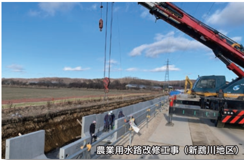
農業用水路改修工事（新鶴川地区）