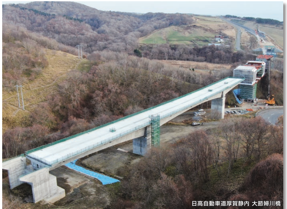
日高自動車道厚賀静内 大節婦川橋