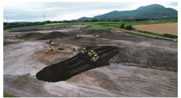
伊達地区 区画整理事実施状況

第9期北海道総合開発計画に掲げられた目標の実現に向け、農業の持続的発展と食料供給の安定化を図るため、農業生産基盤の整備を進めます。