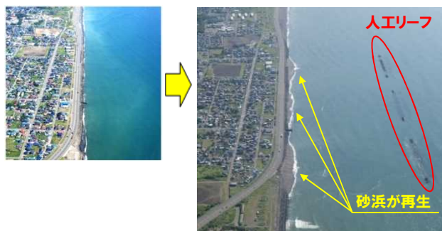
白老工区 人工リーフによる砂浜の再生

人工リーフは、海岸に襲来する高波を沖で弱める施設です。近年は、人工リーフ背後の海岸線に砂浜が再生していることが確認されています。