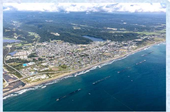
胆振海岸（人工リーフと白老町市街地）