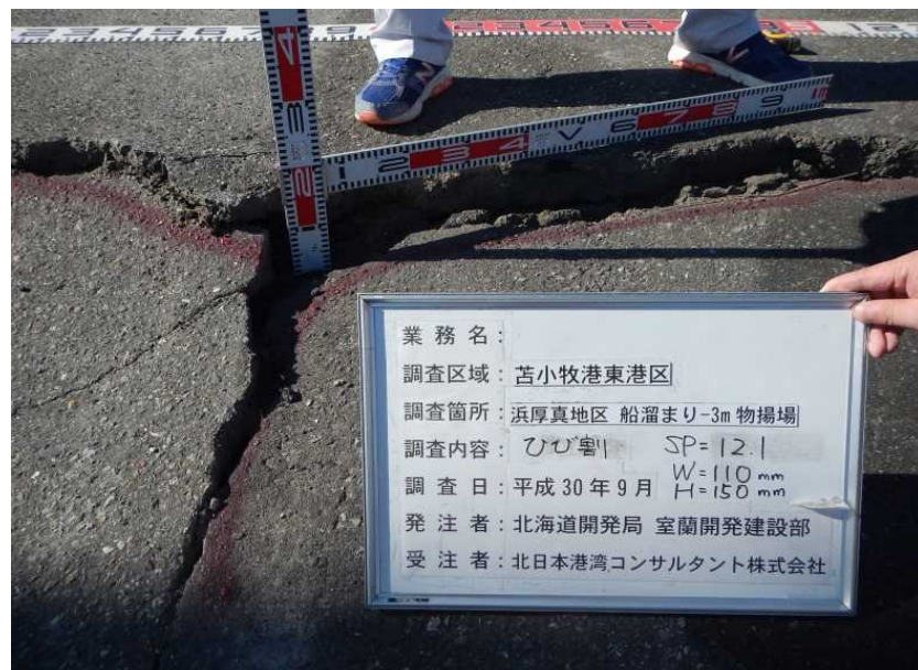
船だまり-3M物揚場 エプロンひび割れ