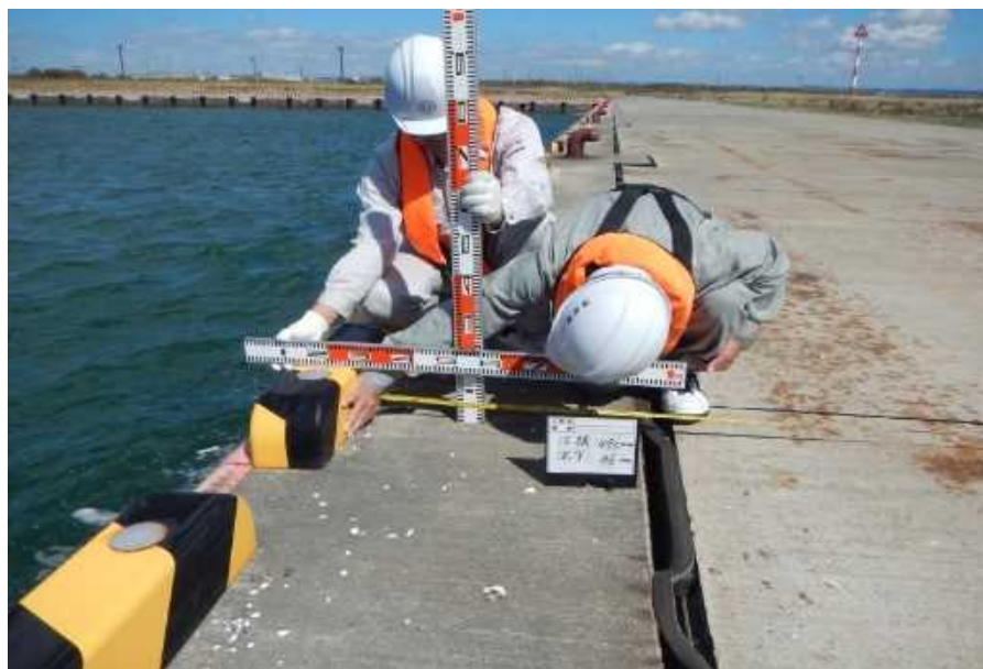
船だまり-4M物揚場 上部コンクリート前出し