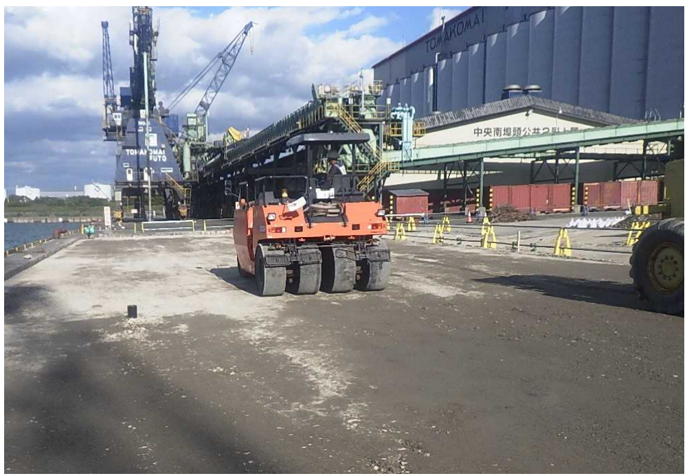
中央南埠頭1・2号岸壁 エプロン路盤締固め状況