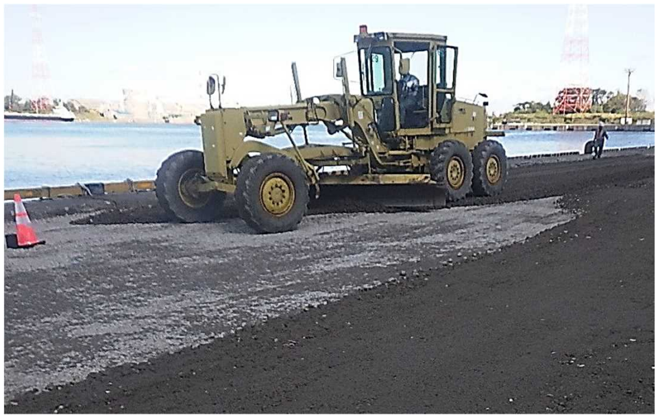
中央南埠頭1・2号岸壁 エプロン路盤敷均し状況