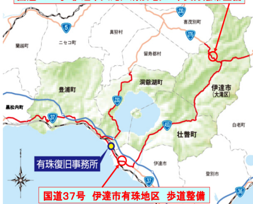
有珠復旧事務所管内図