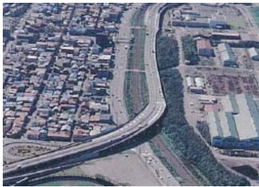
輪西ランプ付近（供用開始当時）

室蘭新道は、昭和40年代に室蘭市内が自動車交通の激増により非常に混雑していたため、渋滞緩和を目的として整備しました。その室蘭新道も昭和56年に供用開始してから30年以上が経過しており、地域の皆さんに安全安心にご利用いただくため、橋梁を長寿命化するための計画的な補修を行っています。なお、工事期間中の交通規制では、ご不便をお掛けし大変申し訳ございませんが、ご協力をお願いいたします。