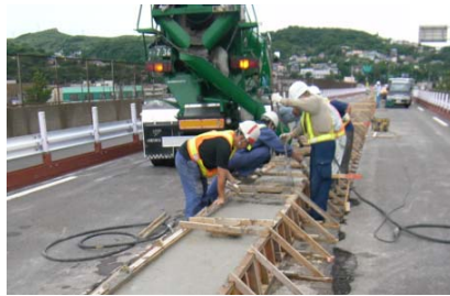
中央分離帯の補修状況