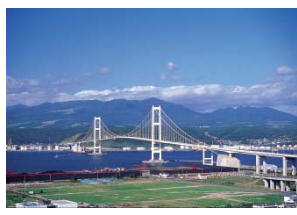
絵鞆側から見た白鳥大橋