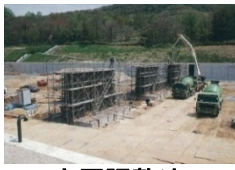
大原調整池の擁壁施工

主に畑地用水が不足している状況を打開するため、貫別川支流大原川上流に調整池を築造したほか、頭首工、揚水機、用水路を整備しました。