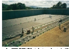
大原調整池におけるゴムシート敷設