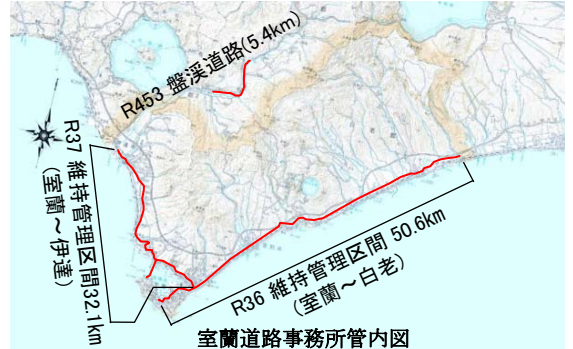
室蘭道路事務所管内図

● 有珠復旧事務所 〒049-5603 虻田郡洞爺湖町入江54番地10 電話0142-76-2550