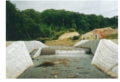
【左上】大原調整池 【右上】三の原頭首工 【左】三の原揚水機