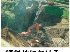
傾斜地における大原用水路の配管