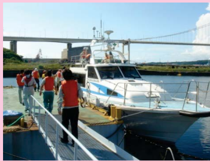
港湾業務艇「みさご」(地域住民)