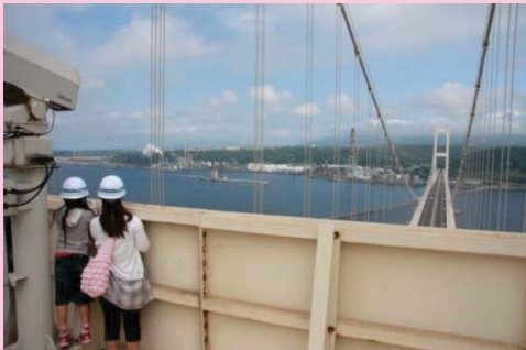
白鳥大橋主塔上部(地域住民)

今月からは、室蘭工大をはじめとする工業系教育機関で学ぶ皆様方を対象とした現場見学会を開催しています。