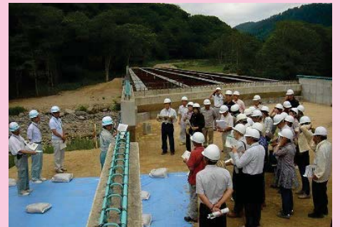
453号壮瞥町道路工事(土木学会)

【発行・編集責任者】 北海道開発局室蘭開発建設部 広報官 0143-25-7051 地域振興対策官 0143-25-7053 〒051-8524 室蘭市入江町1番地14 <室蘭開発建設部ホームページ→ http://www.mr.hkd.mlit.go.jp/ >