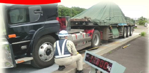
特殊車両の取締の様子

室蘭開発建設部では特殊車両の通行申請・許可等に違反がないか、規定が遵守されているかの取締を、警察の協力を得て行っています。