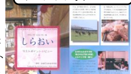
白老町内中学校作成のパンフレット

ウポイの開業効果は町内の賑わいの創出にもつながっており、新規創業・事業拡大や、中学生による観光パンフレットの制作などといった効果が現れています。また、オリンピックの聖火リレーのルートにもなっており、更なる盛り上がりも期待されます。