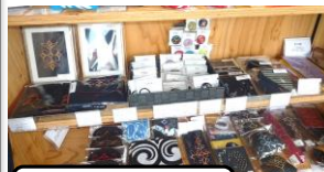
インフォメーションセンター内の売場

ウポイ開設後に町が実施した観光客の消費動向調査結果によると、道外からの観光客比率が増加していますが、来町前に使用を考えていた金額に対し、実際に消費した金額が少ないという傾向にあり、特に宿泊客についてギャップが大きいことから、お土産品等の魅力発信と購買機会の提供策に検討が必要と考えています。白老駅北観光インフォメーションセンターにおいて人気のお土産品は、サブレやラスク、アイヌ文様が刺繍やプリントされた商品、ムックリ(口琴)などがあります。