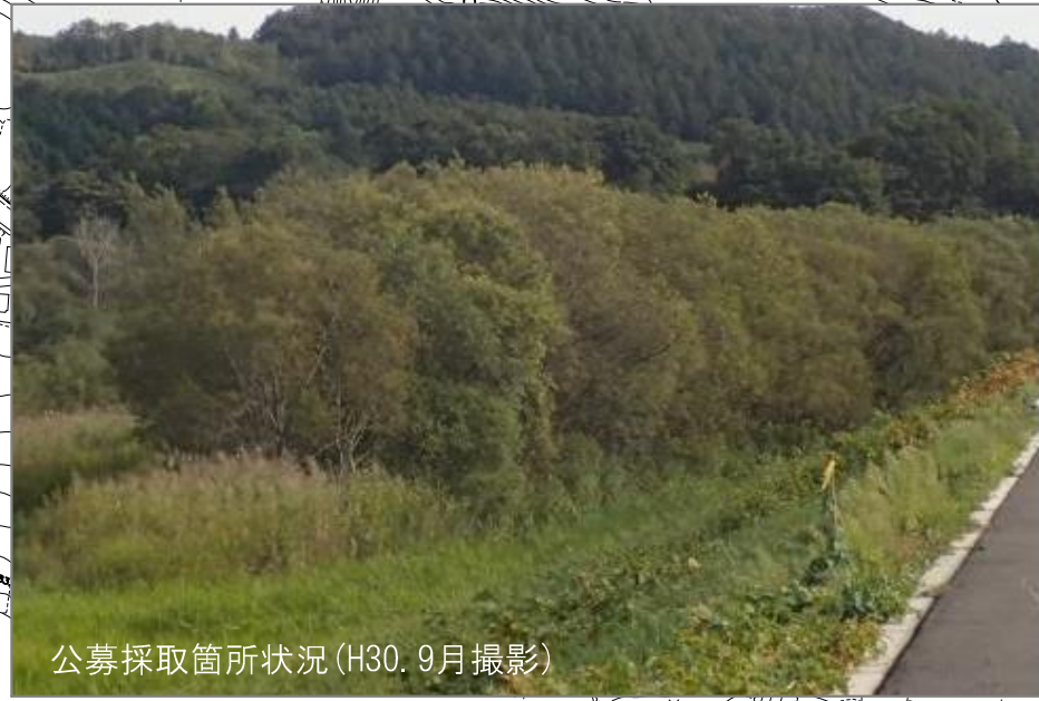
公募採取箇所状況 (H30. 9月撮影)