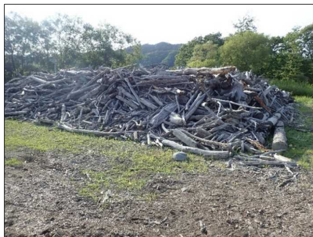
令和3年度 流木配布写真（参考）