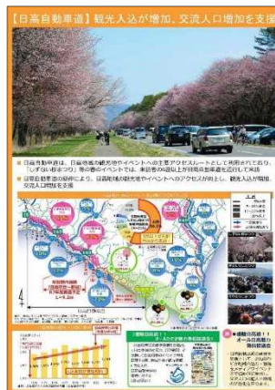
日高自動車道の整備効果パネル