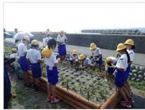
海浜植物の植栽・保護 [富山県：下新川海岸]