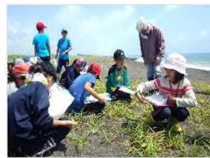
環境教育活動 [北海道：胆振海岸]