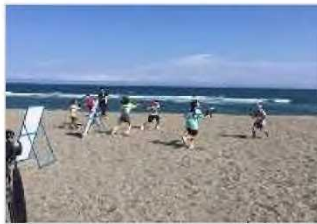
海岸PR活動（水鉄砲大会） [高知県：高知海岸]