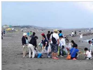
海岸清掃活動 [新潟県：新潟海岸]