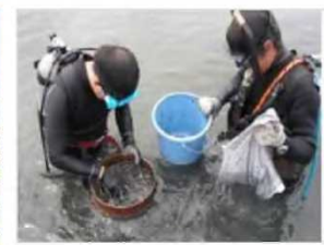
生物育成環境モニタリング [兵庫県：東播海岸]