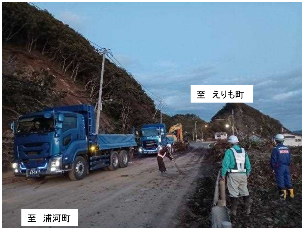
さまにちょうあざうとま ① 国道336号 様似町字鶺鴒 応急復旧作業状況 (10月7日17:00時点)