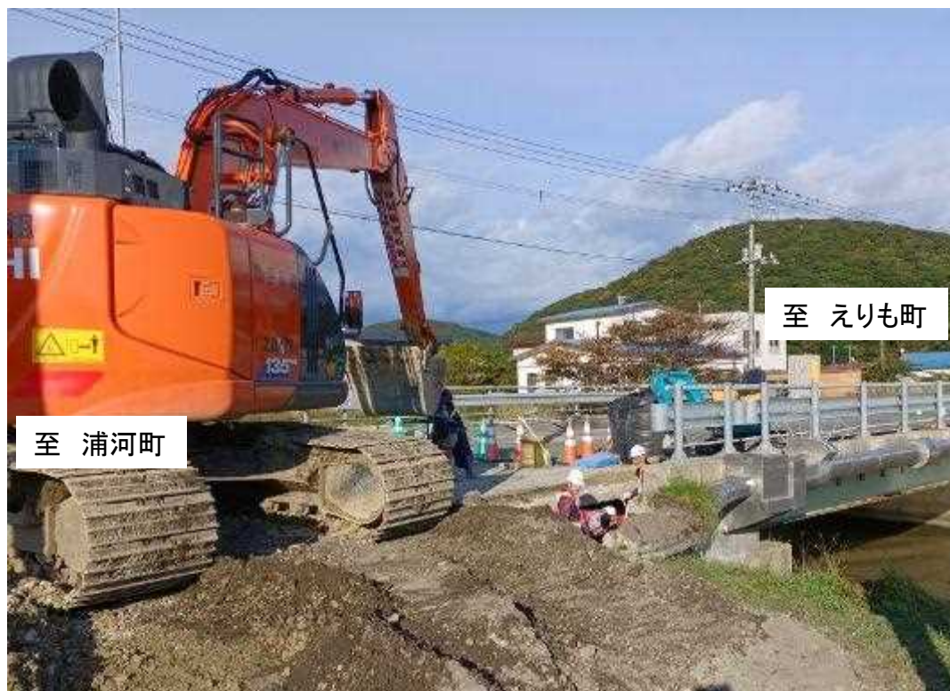
さまにちょうかんべつばし ③ 国道336号 様似町寒別橋 応急復旧作業状況 (10月7日16:00時点)