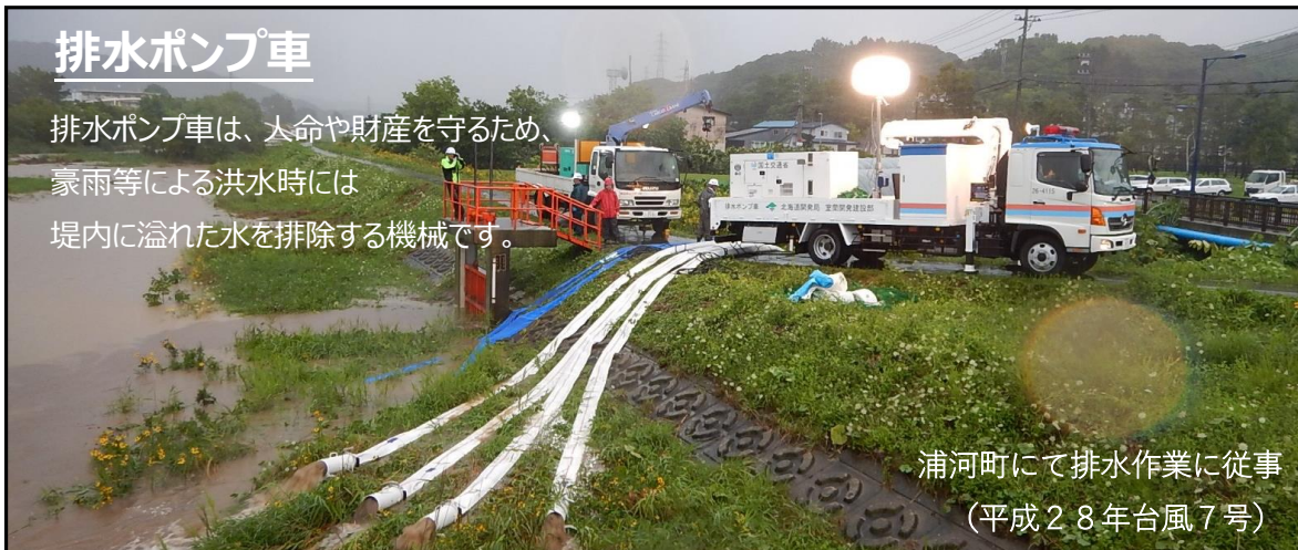
浦河町にて排水作業に従事 (平成28年台風7号)

排水ポンプ車は、人命や財産を守るため、豪雨等による洪水時には堤内に溢れた水を排除する機械です。