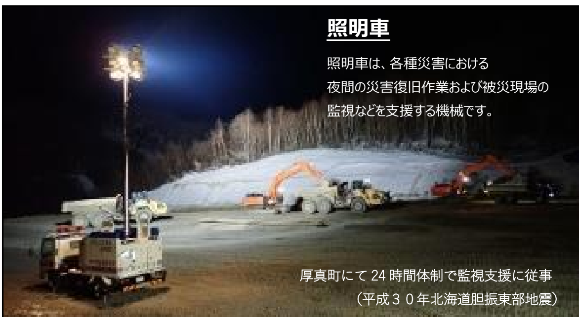
厚真町にて24時間体制で監視支援に従事 (平成30年北海道胆振東部地震)

照明車は、各種災害における夜間の災害復旧作業および被災現場の監視などを支援する機械です。