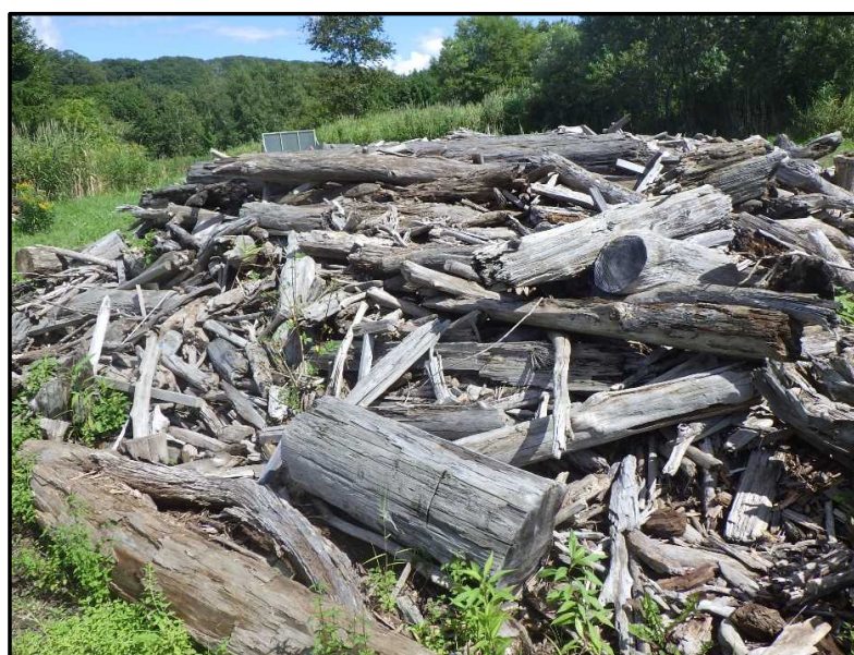
令和6年度 流木堆積状況