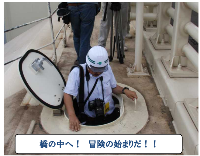
橋の中へ！ 冒険の始まりだ！！