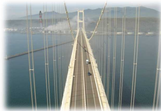
白鳥大橋P4主塔からの眺望