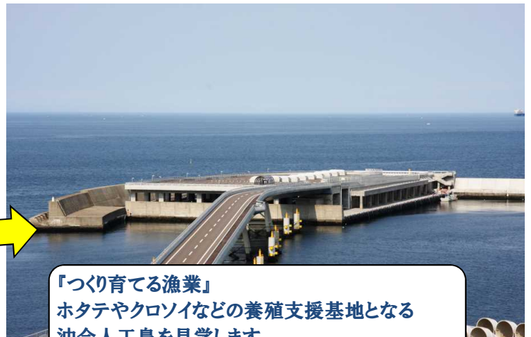
「つくり育てる漁業」 ホタテやクロソイなどの養殖支援基地となる 沖合人工島を見学します。