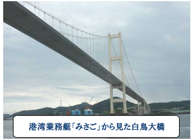
港湾業務艇「みさこ」から見た白鳥大橋