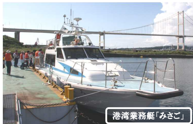
港湾業務艇「みさご」