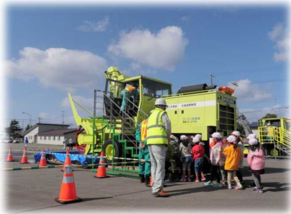
▲ ロータリ除雪車の説明状況