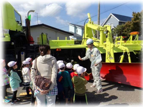
▲ 除雪トラックの説明状況