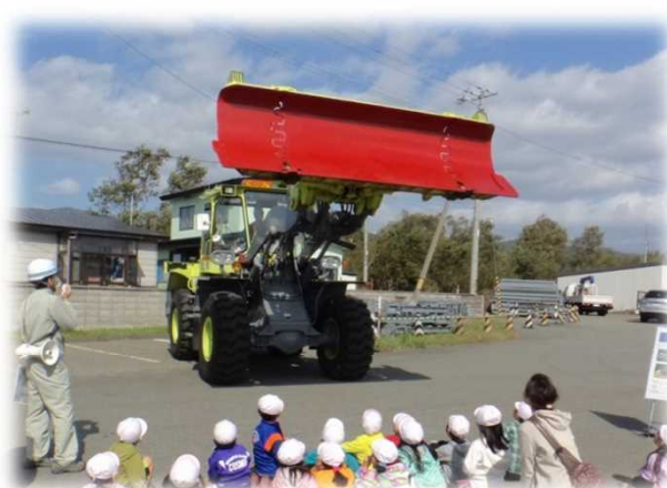
▲ 除雪ドーザの説明状況