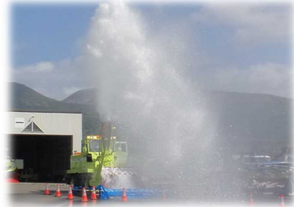
▲ 迫力のロータリ除雪車実演