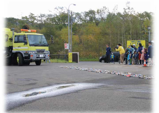
▲ 路面清掃車の実演