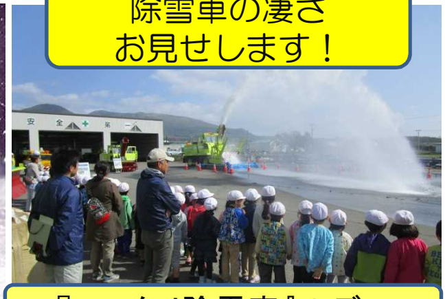
『ロータリ除雪車』のデモ