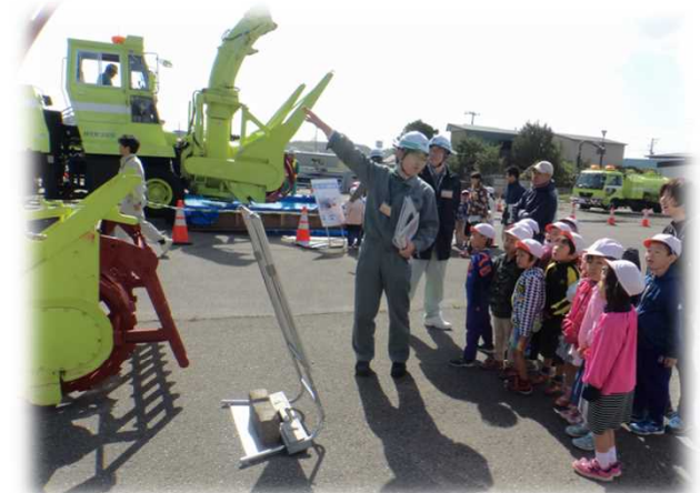
▲ 小形除雪車の説明状況