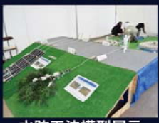
水防工法模型展示