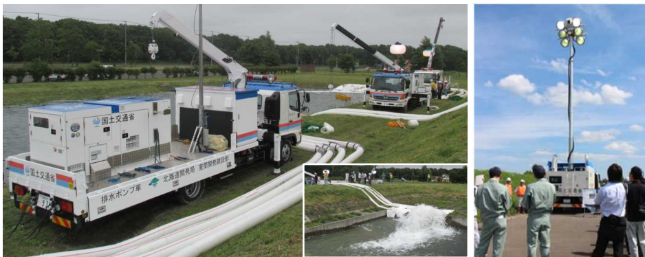
室蘭開発建設部災害対策用機械操作訓練 実施状況