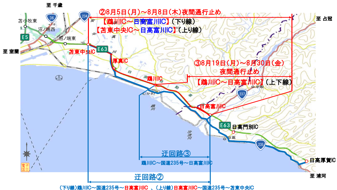
(下り線)鷺川IC~国道235号~日高富川IC、(上り線)日高富川IC~国道235号~苦東中央IC