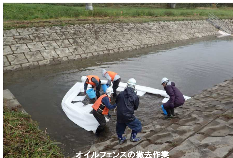
オイルフェンスの撤去作業