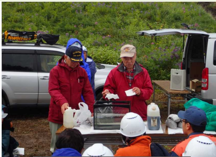
油流出事故対策資材のデモンストレーション