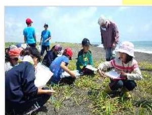
環境教育活動 [北海道：胆振海岸]