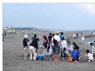
海岸清掃活動 [新潟県：新潟海岸]