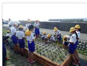
海浜植物の植栽・保護 [富山県：下新川海岸]