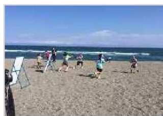
海岸PR活動（水鉄砲大会） [高知県：高知海岸]