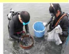
生物育成環境モニタリング [兵庫県：東播海岸]