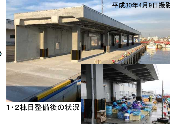
1・2棟目整備後の状況