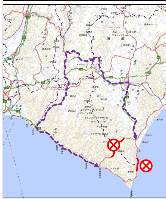
②、④迂回路 国道235号～国道237号(日高峠)～国道38号～国道236号