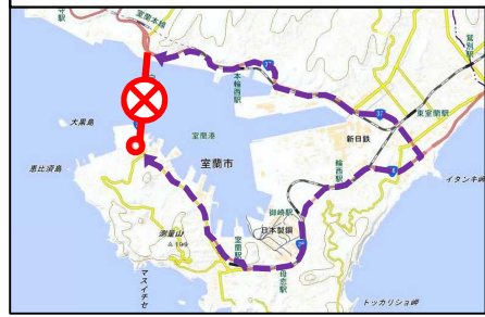
③迂回路 道道室蘭港線～国道36号～国道37号