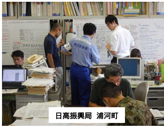
日高振興局 浦河町