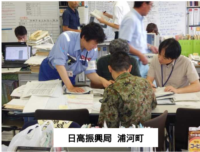
日高振興局 浦河町