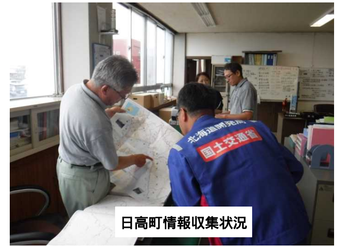
日高町情報収集状況