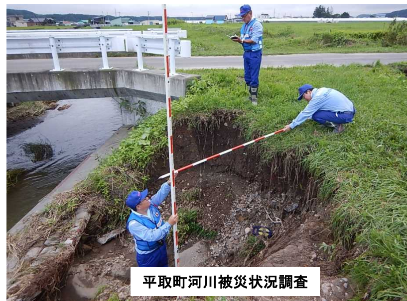
平取町河川被災状況調査