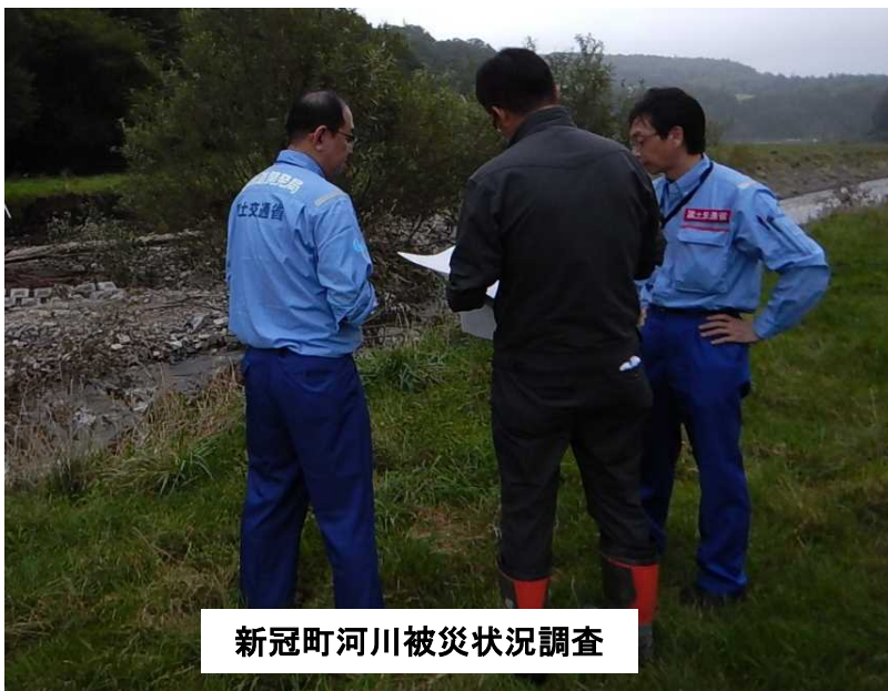
新冠町河川被災状況調査