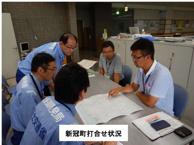
新冠町打合せ状況