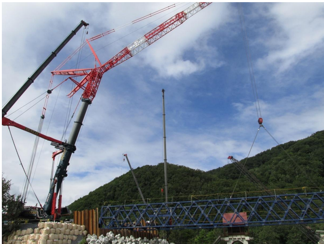
△復旧作業用仮橋架設状況① (H28.9.10)