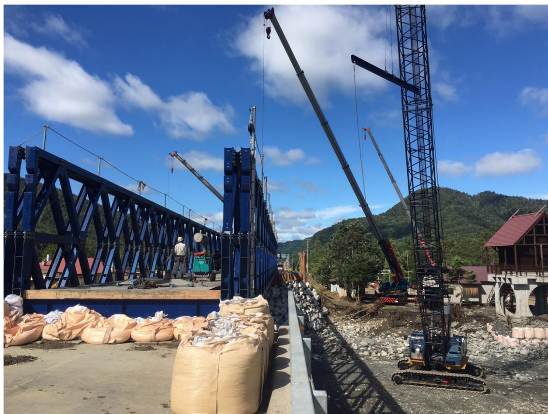
△復旧作業用仮橋架設状況② (H28.9.11)