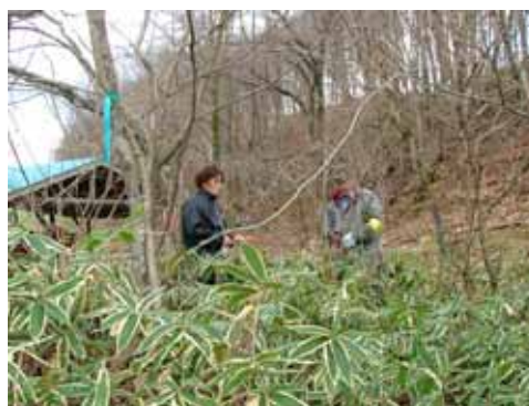
道道沿いを調査中