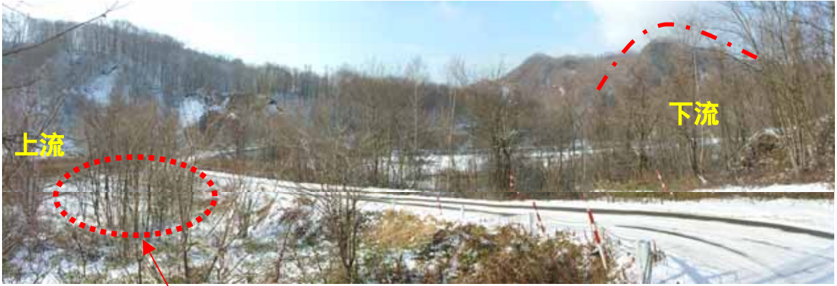
番兵小屋があった場所