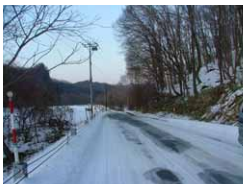
0m 起点付近の道道芽生貫気別線