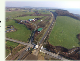
日高町清富から厚賀方向を望む

日高自動車道は北海道縦貫自動車道苫小牧東ICから分岐して浦河に至る延長約120kmの一般国道の自動車専用道路で、平成24年3月までに日高門別ICまでが開通しています。現在、静内までの区間で事業が行われており、平成29年度には日高門別IC～厚賀IC(仮称)の開通を目指して鋭意工事を進めています。