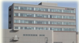
災害拠点病院に指定されている浦河赤十字病院