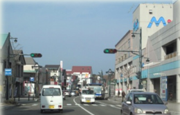
整備された浦河町の街並み(国道235号沿い)