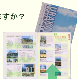
浦河町体験移住のパンフレット