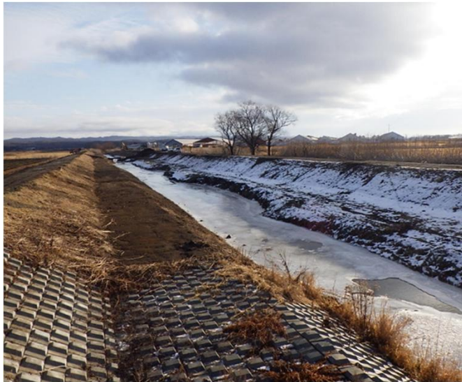
河道掘削等の実施