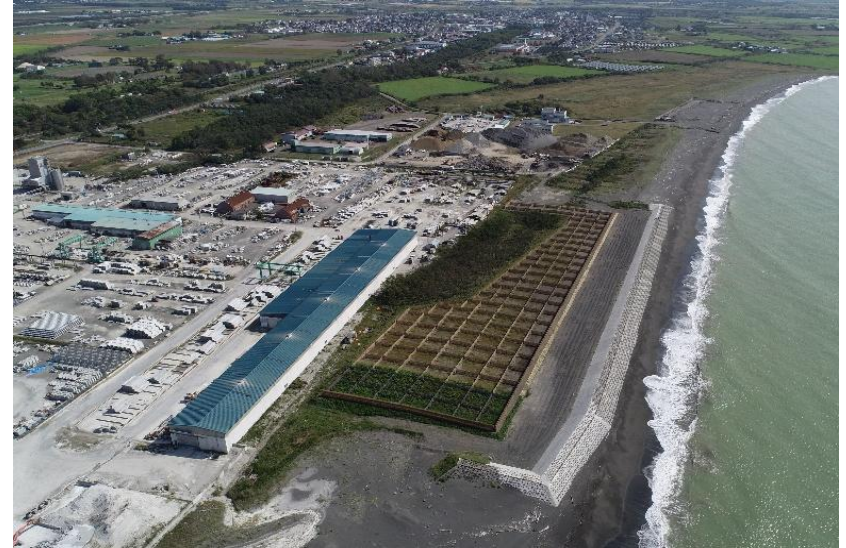
民有林内における防災林の整備