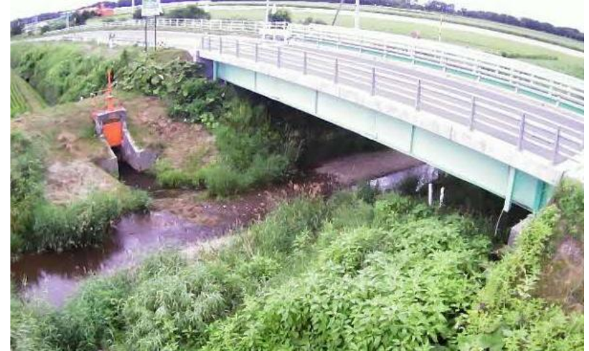
(入鹿別川) 簡易型河川監視カメラによる映像提供

危機管理型水位計や簡易型河川監視カメラによる 河川情報の提供 (胆振総合振興局)