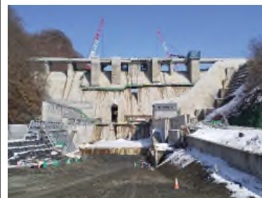
平取ダム堤体建設工事 全景