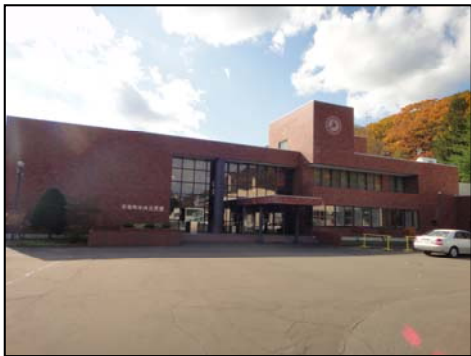
【平取町中央公民館】