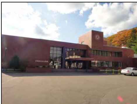
【平取町中央公民館】