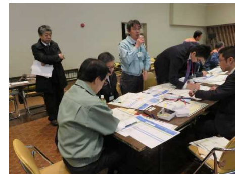
町からの情報連絡