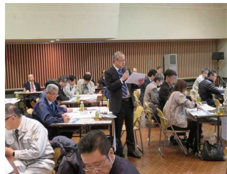
気象情報の伝達（訓練開始）