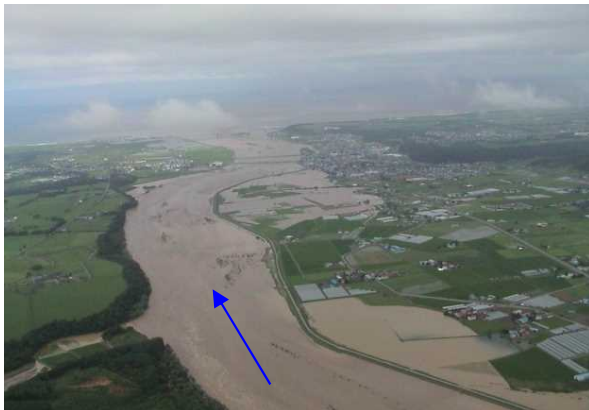
H15. 8沙流川下流の状況