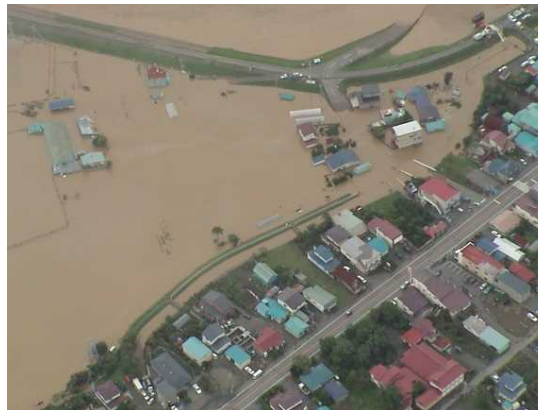
H15. 8沙流川下流の状況