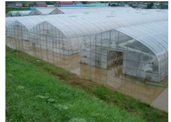
H18. 8平取町野菜地区の浸水状況