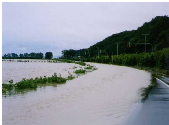
H13. 9道道米原田浦線冠水