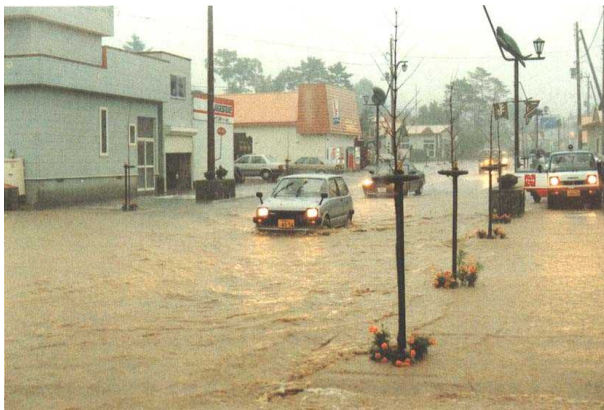
H4. 8穂別地区市街部浸水