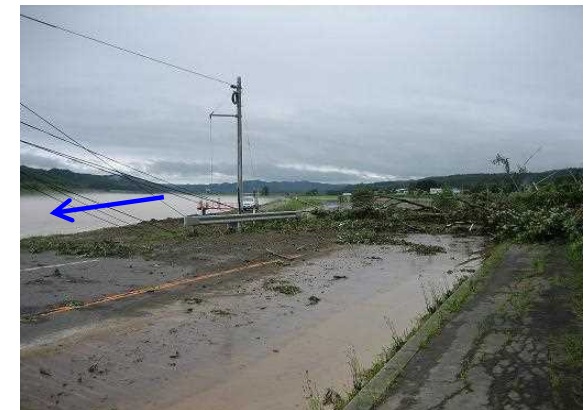
H18. 8道道穂別鷓川線土砂崩れ