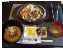
▲白糠タコつぶステーキ丼