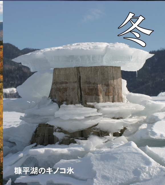
糠平湖のキノコ氷