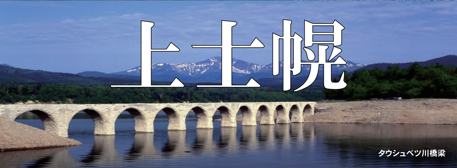
タウシュベツ川橋梁