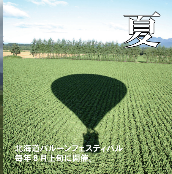
北海道バルーンフェスティバル 毎年8月上旬に開催。