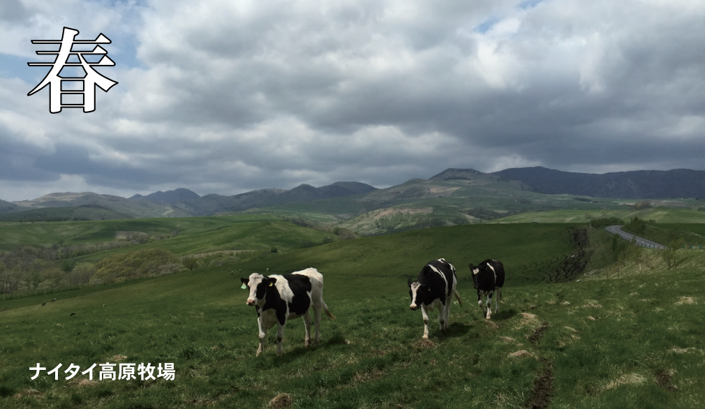
ナイトハイ高原牧場