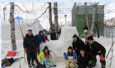
雪との戦いに勝利した勇者の姿