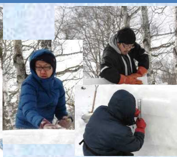
これぞ、帯広開建の匠の技