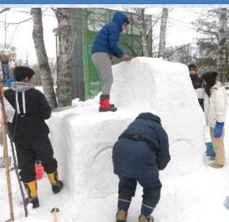
だんだん形が見えてきました