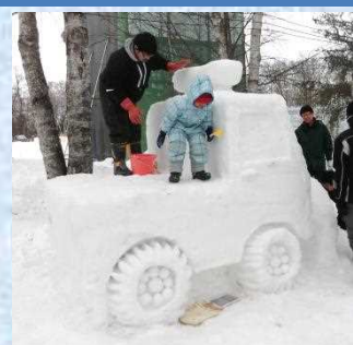
だいぶできてきたぞ！