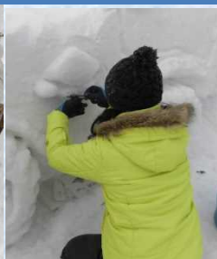
開発局マークを刻み、仕上げです