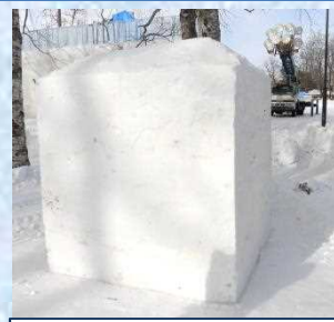
でも、どうやって雪の固まりから作っていくの？