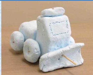
はじめに、模型を作りました

雪のエキスパートが極寒の緑ヶ丘公園に集結。冬の帯広を盛り上げるべく匠の技を発揮しました！