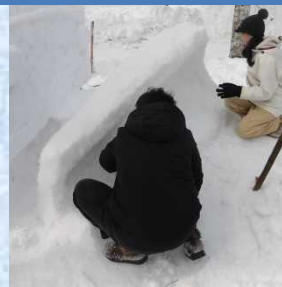
雪を飛ばすプラウを取り付ければあと少し