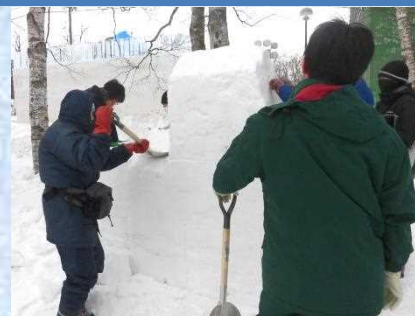
まずは、荷台から削り始めます