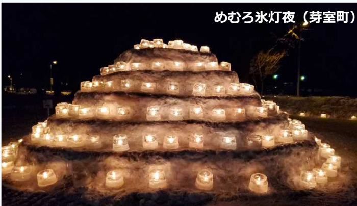
めむろ氷灯夜 (芽室町)