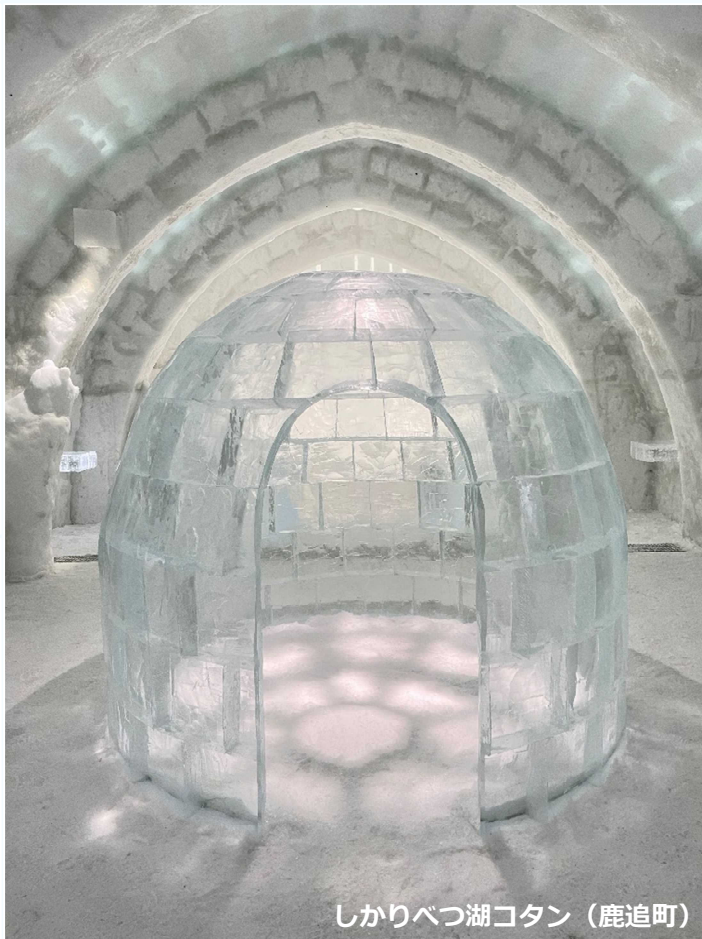
しかりべつ湖コタン (鹿追町)