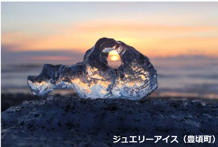
ジュエリーアイス (豊頃町)