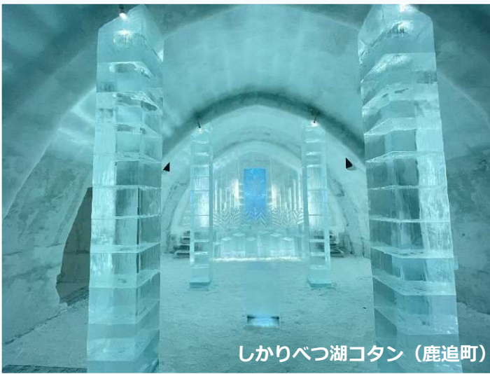
しかりべつ湖コタン (鹿追町)