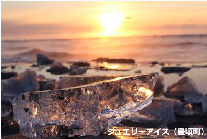
ジュエリーアイス (豊頃町)