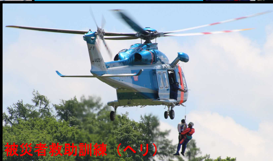
被災者救助訓練（ヘリ）

洪水等の被害における迅速な救助を 関係機関とともに 連携・協力 して 行っていきます。