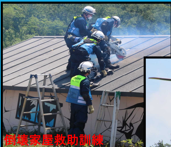
倒壊家屋救助訓練

洪水・出水に備え水防関係機関との密接な連携と水防技術の向上、 水防意識の高揚を図るとともに、 地域住民に水防への理解を深めていただくことを目的としております。