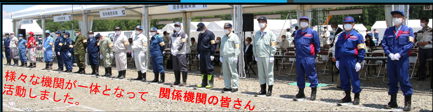
様々な機関が一体となって 関係機関の皆さん 活動しました。

また、演習は洪水対策訓練の他、 地域交流会場では児童が楽しみながら 災害に関する疑似体験や見学ができます。