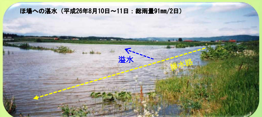
ほ場への湛水 (平成26年8月10日～11日: 総雨量91mm/2日)