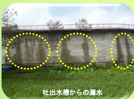
吐出水槽からの漏水