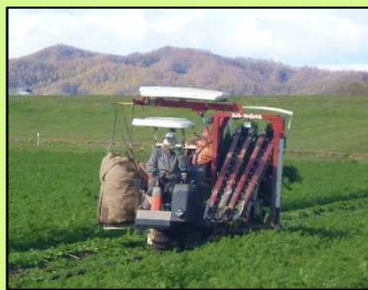
「受委託生産方式」によるにんじんの収穫風景