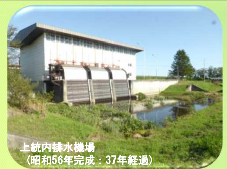
上統内排水機場 (昭和56年完成: 37年経過)

また、排水機場、排水路の排水施設は、経年的な劣化により施設の維持管理に多大な費用と労力を要している。